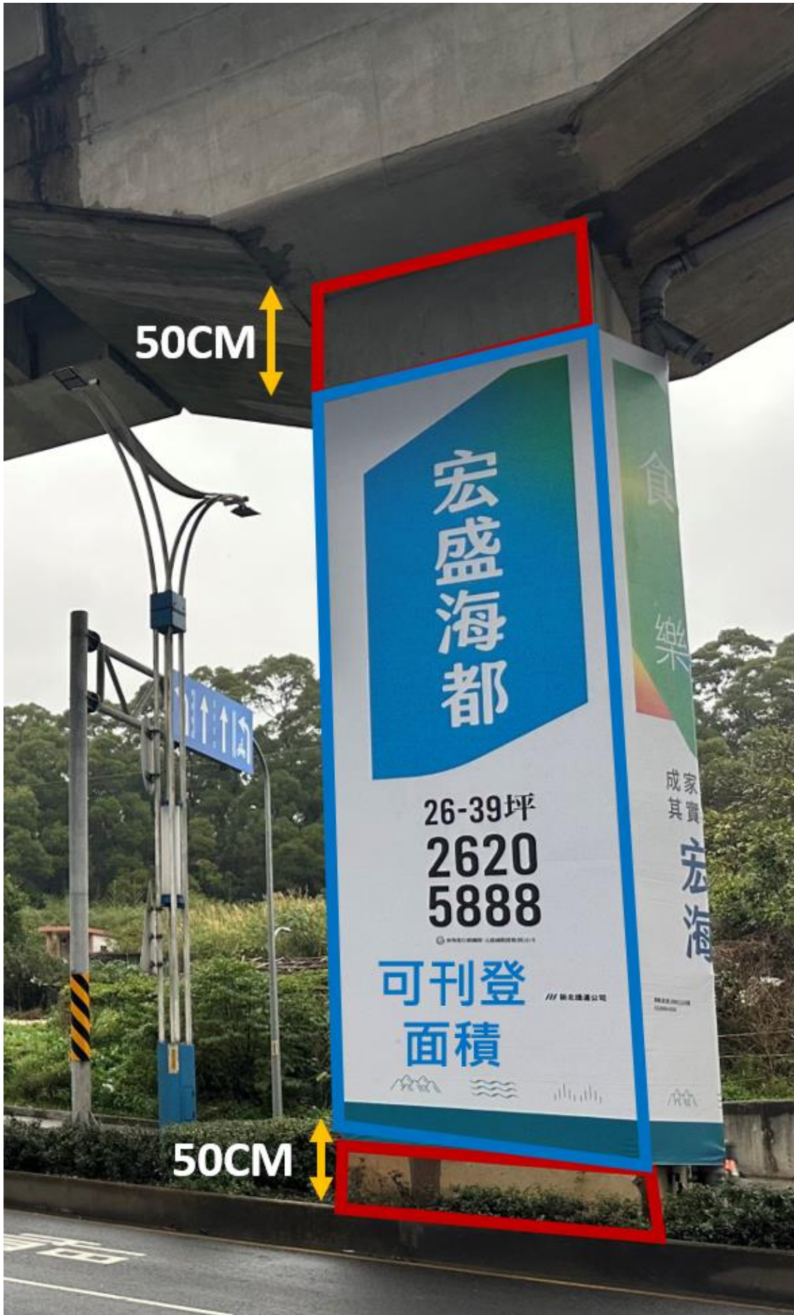
墩柱可刊登面積範圍示意圖